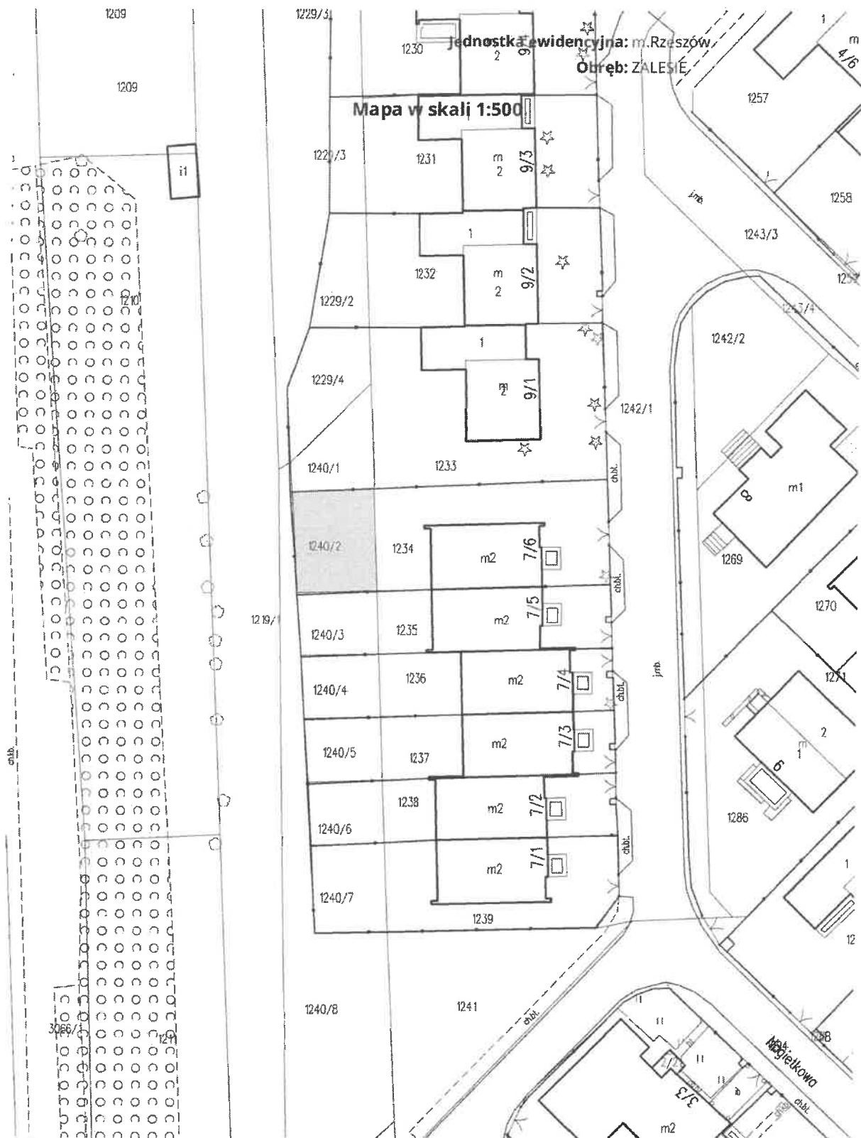
Załącznik nr 1 do Uchwały Rady Miasta Rzeszowa Nr X/139/2024 z dnia 27 sierpnia 2024 r.